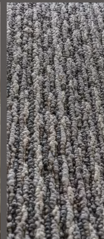
3304 | COLLAGE