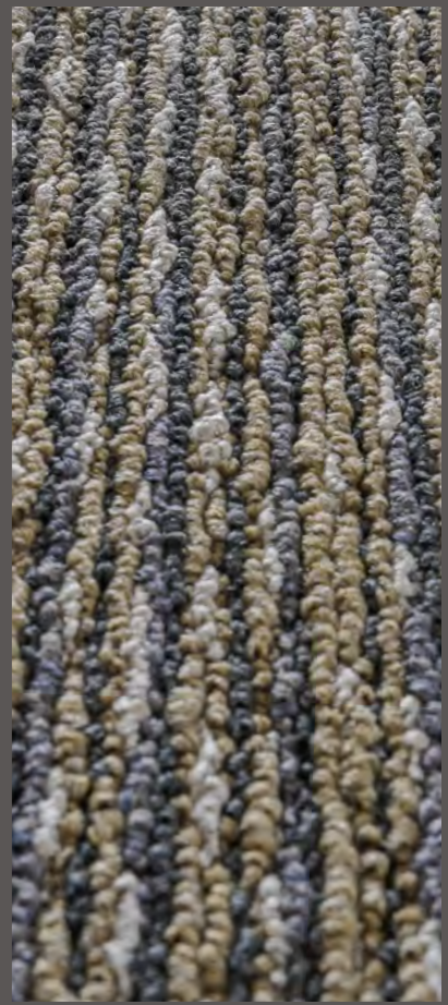
3301 | FRESCO