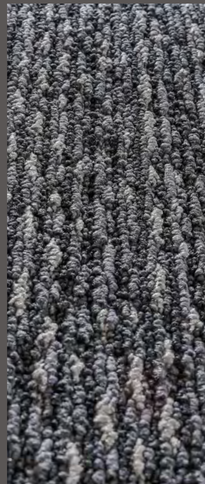
3302 | SCRIBE