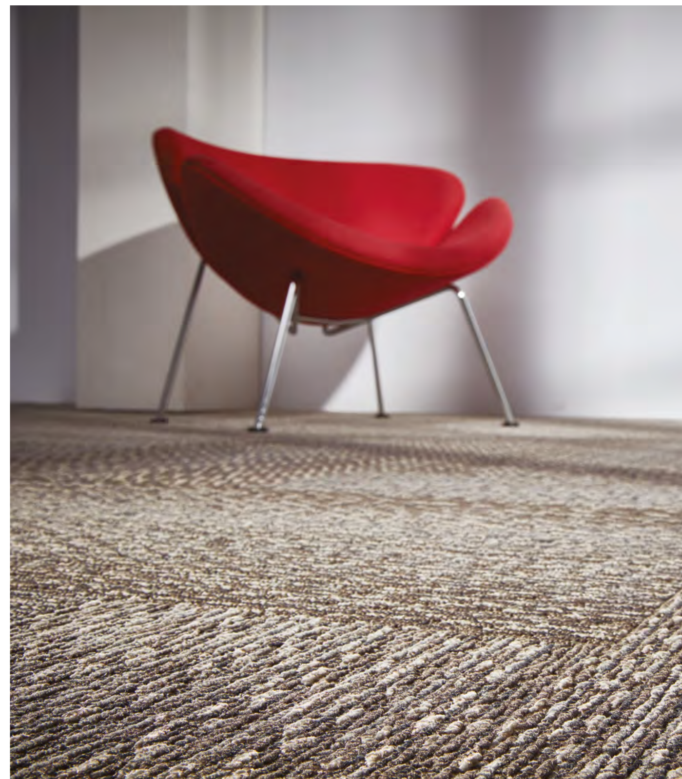
3306 | MACRAME

Wszystkie biura sprzedaży Forbo Flooring Systems działają zgodnie z wymogami Systemu Zarządzania Jakością ISO 9001. Wszystkie zakłady produkcyjne Forbo Flooring Systems działają zgodnie z wytycznymi Systemu Zarządzania Środowiskowego ISO 14001. Analiza Cyklu Życia Produktu (z ang. LCA - Life Cycle Assessment) dla produktów Forbo Flooring Systems jest przedstawiona w Deklaracjach Środowiskowych Produktu (z ang. EPD - Environmental Product Declarations) zamieszczonych na naszych stronach internetowych.