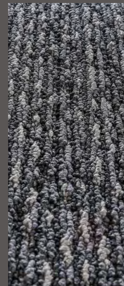
3302 | SCRIBE