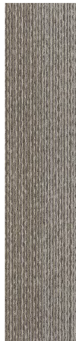
3305 | ORIGAMI LRV 18