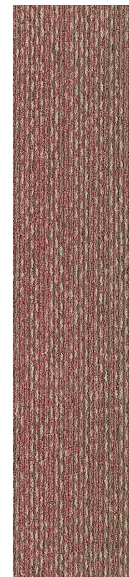
3309 | EMBROIDERY LRV 13