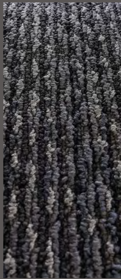
3303 | CALLIGRAPHY

Kolory na zdjęciach mogą odbiegać od rzeczywistych kolorów. Zamówienie próbek prosimy kierować na adres: info.pl@forbo.com