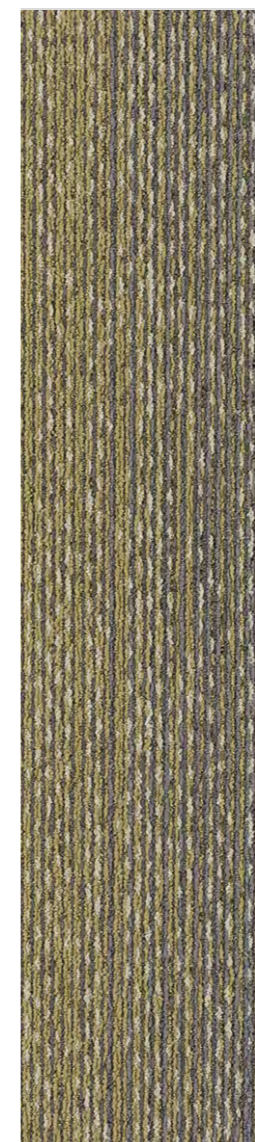
3301 | FRESCO LRV 13