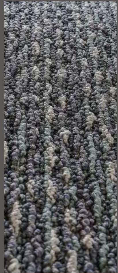
3300 | WATERCOLOR