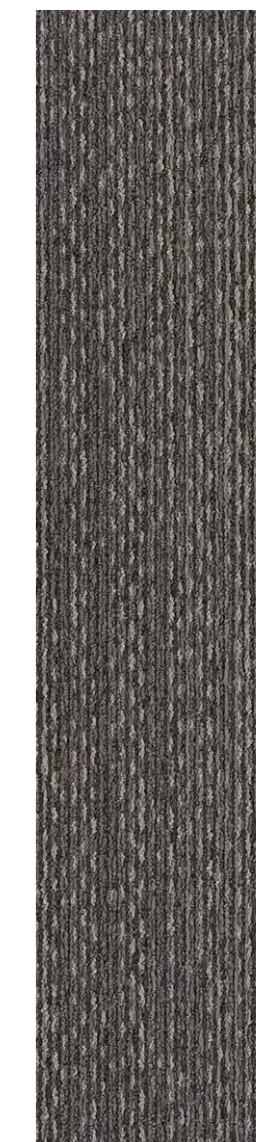
3302 | SCRIBE LRV 10