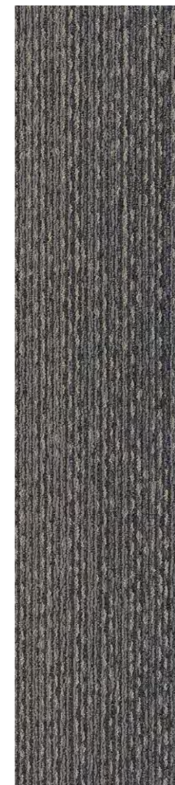
3303 | CALLIGRAPHY LRV 10