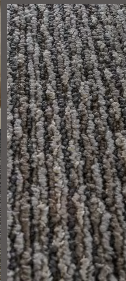
3305 | ORIGAMI

Kolory na zdjęciach mogą odbiegać od rzeczywistych kolorów. Zamówienie próbek prosimy kierować na adres: info.pl@forbo.com