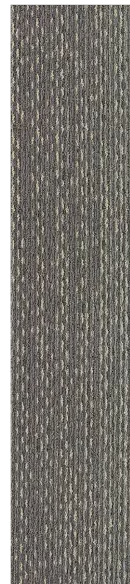
3300 | WATERCOLOUR LRV 15