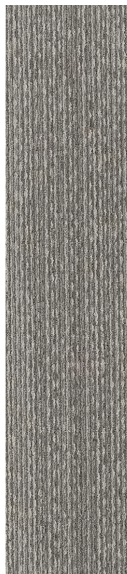
3304 | COLLAGE LRV 15