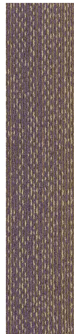
3308 | TAPESTRY LRV 12