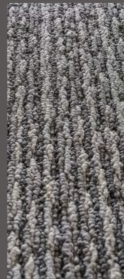
3304 | COLLAGE