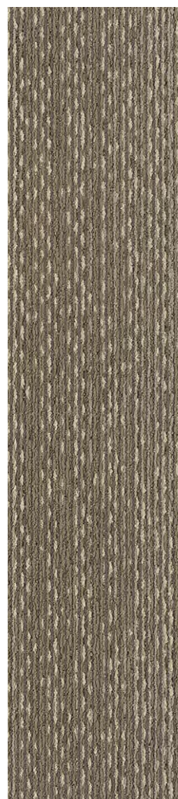
3306 | MACRAME LRV 13